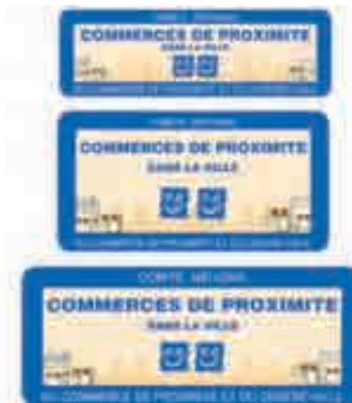
100 cm x 40 cm

Pour obtenir le fichier des panneaux en haute définition nous contacter au: 273 rue Gabriel Péri - 92700 Colombes Tél: 01 47 81 15 52 - E-mail : contact@qcv92.com