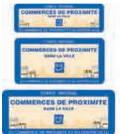
80 cm x 25 cm

Dimensions conseillées pour les panneaux :