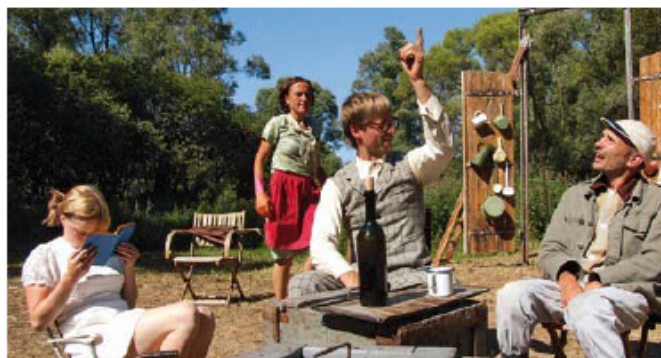
Le spectacle Manon et Jean de Florette , de Marcel Pagnol, par la Compagnie Marius, ouvrira la saison de la Scène nationale, du 1 er au 11 octobre, en plein air au Carré Sénart, sur le site du futur Théâtre, près du San.