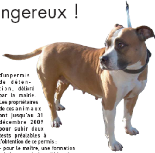
Les chiens de catégorie I, dit "chiens d'attaque", doivent obligatoirement porter une muselette et être tenus en laisse.

Si vous faites partie de ces 60 Moisséens, renseignez-vous et demandez la liste des professionnels agréés auprès de la police municipale au 01 64 88 17 00. ■